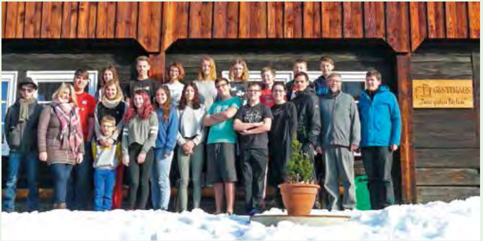
Teenie-Rüstzeit Febr. 2018 in Wohlbach (Text auf Seite 15)

Wir wünschen Ihnen eine fröhliche Frühlingszeit!